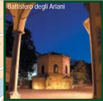
Battistero degli Ariani