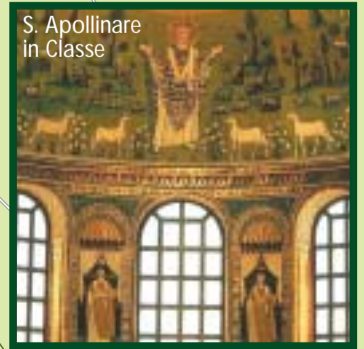
S. Apollinare in Classe