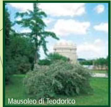
Mausoleo di Teodorico